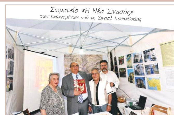
Μέλη του Δ.Σ. με τον Δήμαρχο Πειραιά κ. Βασίλη Μιχαλολιάκο στο περίπτερο του Σωματείου μας στην Πλατεία Κανάρη (Πασαλιμάνι).